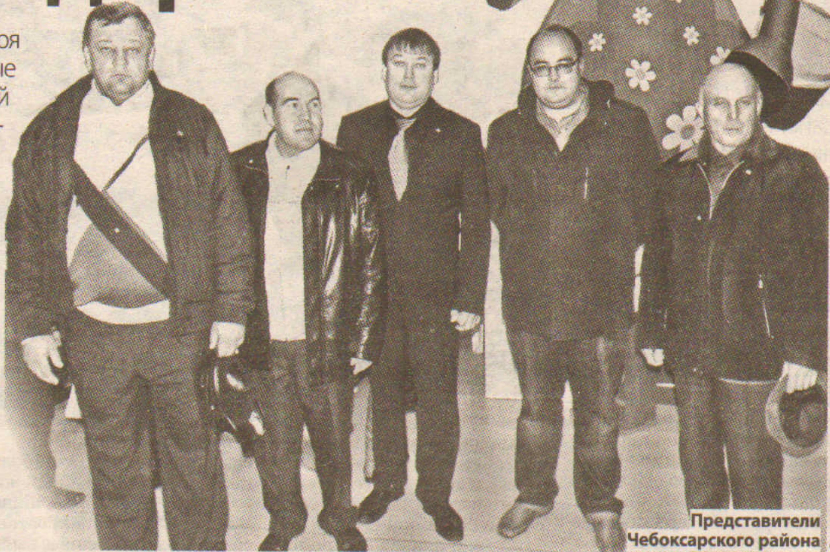
Представители Чебоксарского района