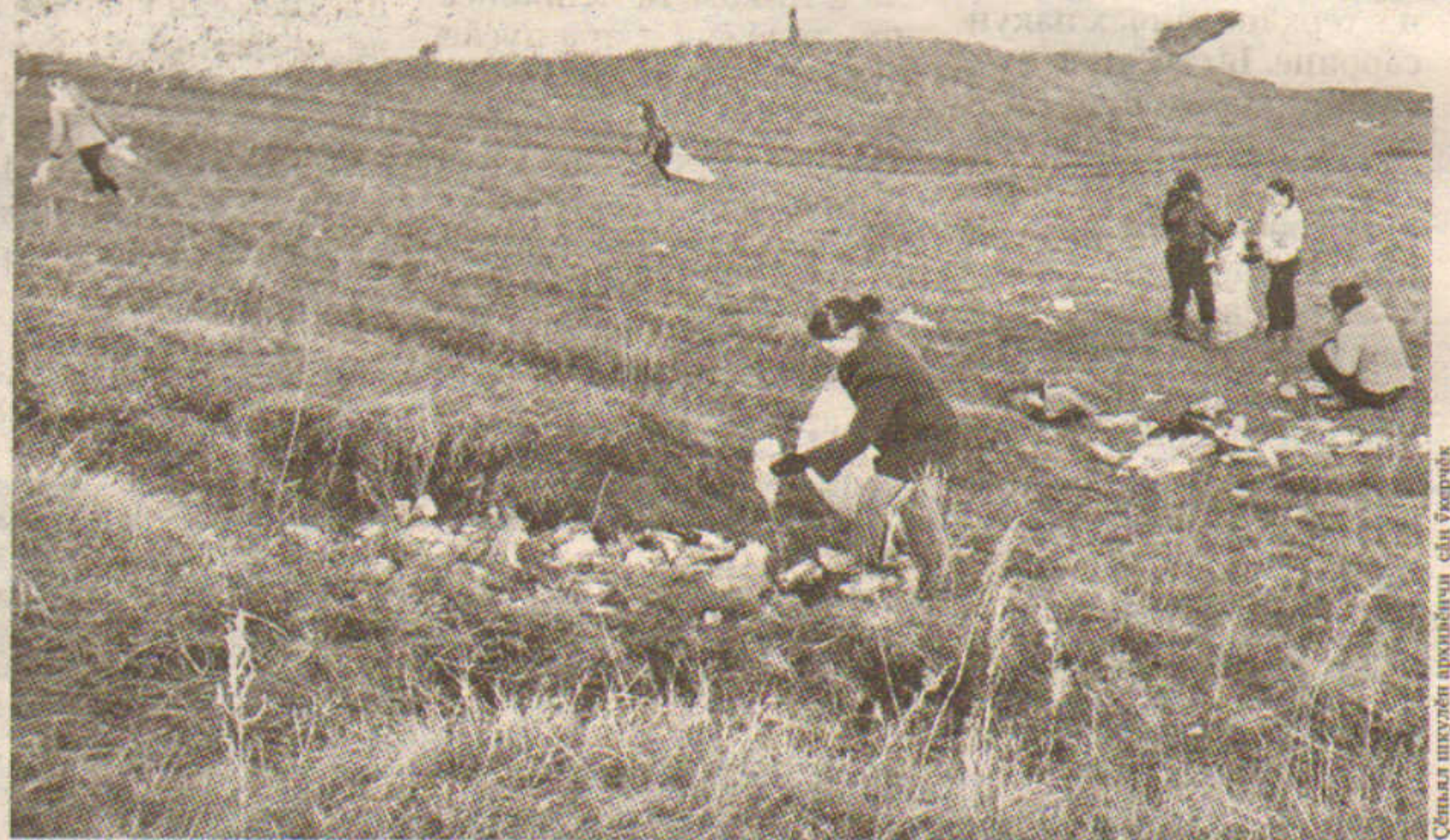
Сәмрәк пухни сәмки айне сүрәнәт тесе ахальтен каламасчө.

Экологи бригадин сүрөкөнсем тәван тавраләха сүп-сәпран тасатнипе пөрле сүркунне тата көрөкүнне йывасөсөм лартасчө. Унта ытти шукул ачитө хушәнат. Йывасөсөне сүрмасөм хөррине, вөсөм юхәнса ан кайччәр тесе, лартма тәрәшасчө. Халө сәмрәк экологсөм макуләтура пуштарасчө. Кунсәр пусөне шукулта ачәсөне тәван тавраләха упрәма вөрентмөшкөн экологи темипө үкөрчөккөн конкурсөсөм, виторинәсөм иртөсчө. Савән пөкөх ситөсө пыракан әрәва өксүрсисөне те илсө тухасчө. Ачәсем сәваплә ыраңсенсө ситсө кураччө,