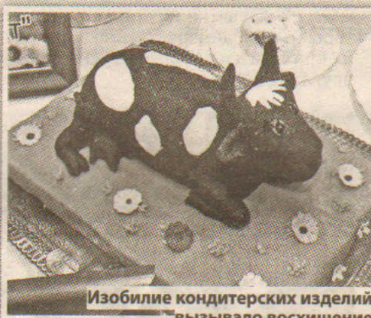
Изобилие кондитерских изделий вызвало восхищение